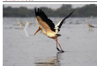
JAKARTA, Sept. 15, 2019 (Xinhua) -- A milky stork flies during migration time at Rambut island in Jakarta, Indonesia, Sept. 15, 2019.